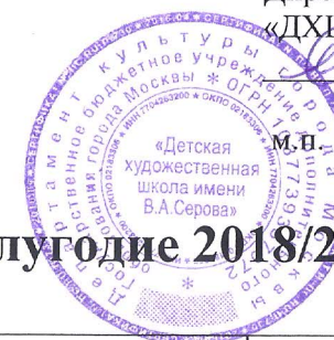
График учебных занятий групп самокупаемости 2 полугодие 2018/2019 год